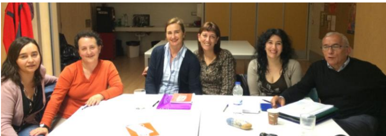
LA JUNTA DIRECTIVA

Por último, no podemos olvidarnos de agradecer su aportación a todas las personas y entidades públicas y privadas, que hacen posible que sigamos adelante con la misión de Aspace - Alava.